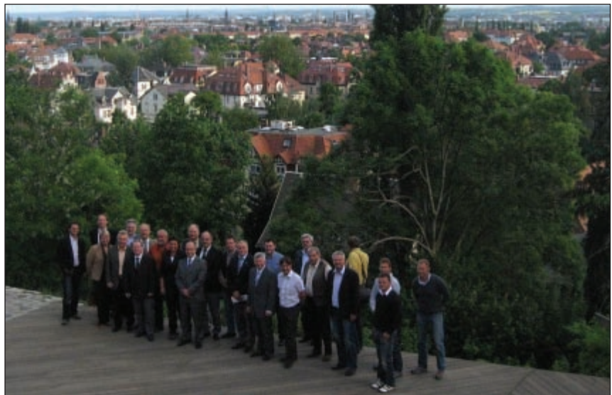
Teilnehmer der Landesverbandssitzung Sachsen/Sachsen-Anhalt in Dresden