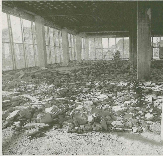
Abbruch der Abhängedecken, nicht tragender Zwischenwände und Estrichfußböden in allen Geschossen.

DRESDEN (ABZ). – Verantwortlich für Abbruch und Sanierung des Gebäudes zeichnet sich die Caruso Umweltservice GmbH aus Großpöna. Der Kulturpalast Dresden – mitten im Zentrum der Stadt gegenüber dem Altmarkt gelegen – wurde 1969 eröffnet. Das Gebäude war Sitz der Dresdner Philharmonie sowie der Konzert- und Kongressgesellschaft mbH Dresden (KKG). Seit Mitte 2008 ist der Kulturpalast als Kulturdenkmal gemäß Sächsischem Denkmal-