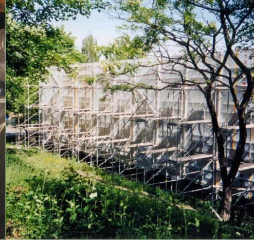
Bild links: Einsatz einer 4-Kammer-Personalschleuse zur Asbestsanierung Bild rechts: Komplett einhausung und Unterdruckhaltung, Regelungsbehörde für Telekommunikation und Post in Dresden