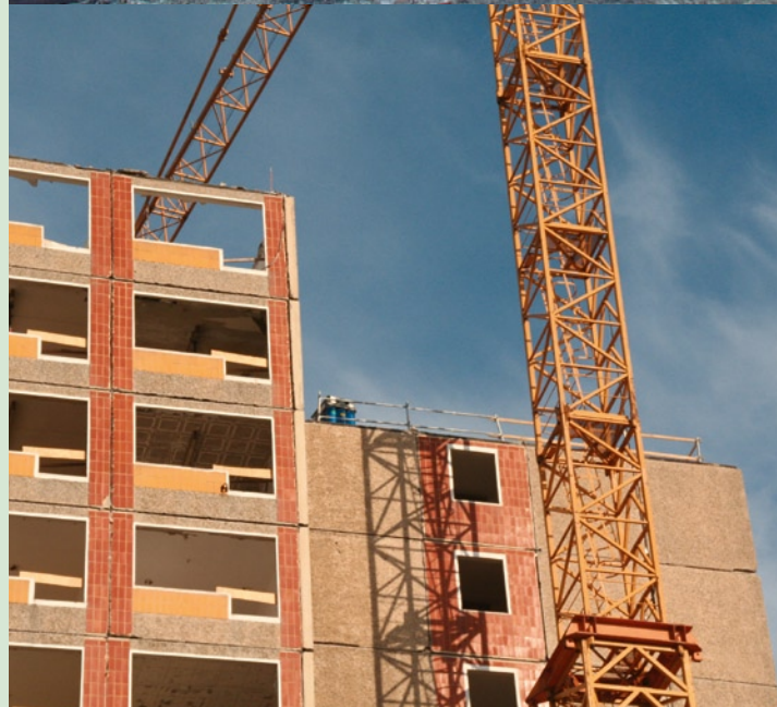
Bild oben: Demontage „Doppel-M“, Alte Messe Leipzig Bild unten: kranunterstützte Demontage eines 16-geschossigen Punkthochhauses (PH16) in Magdeburg