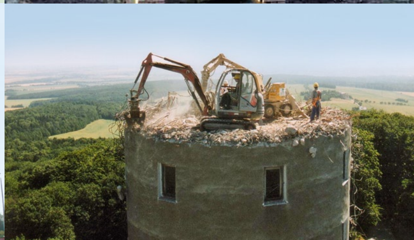
Bild oben: Industrieabbruch mit Longfrontbaggern (Hasatronic/Halle)